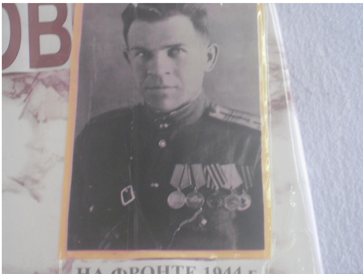
Фотография военной поры. 1944 год.