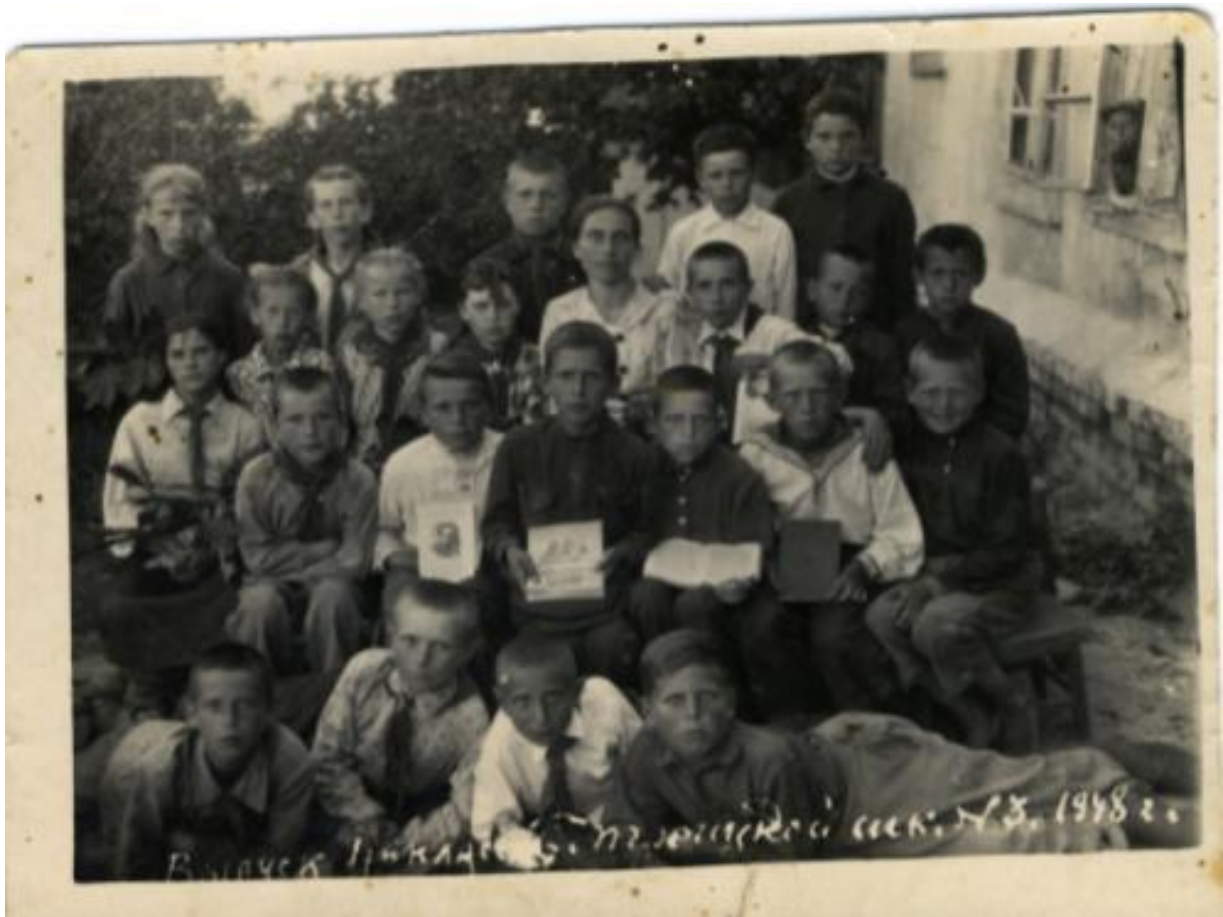
Первый послевоенный выпуск 4-й класс, Большепетровской школы № 3