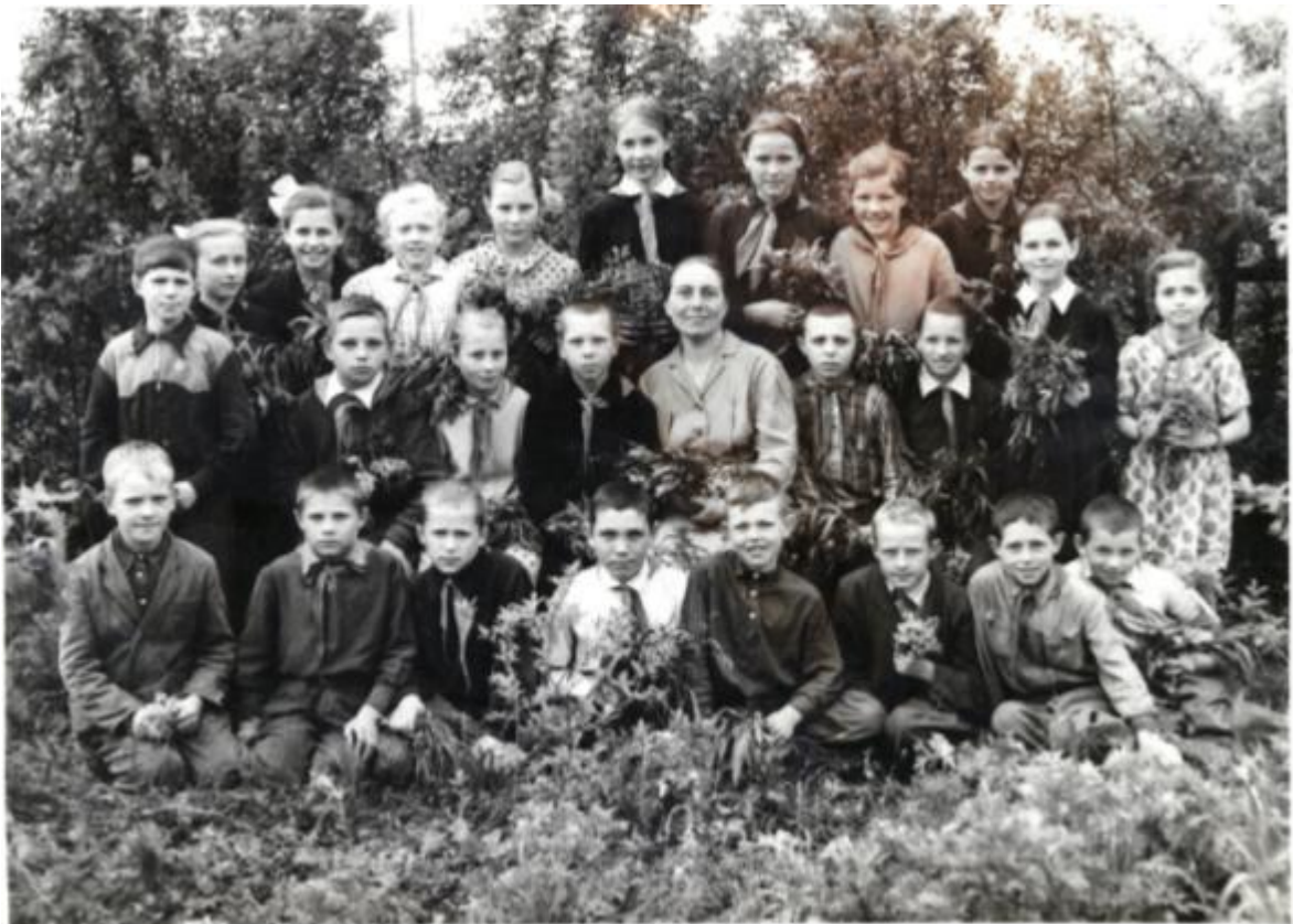
Последний выпуск 4 класс Верхне-Березовской школы 25.V.1963 г.