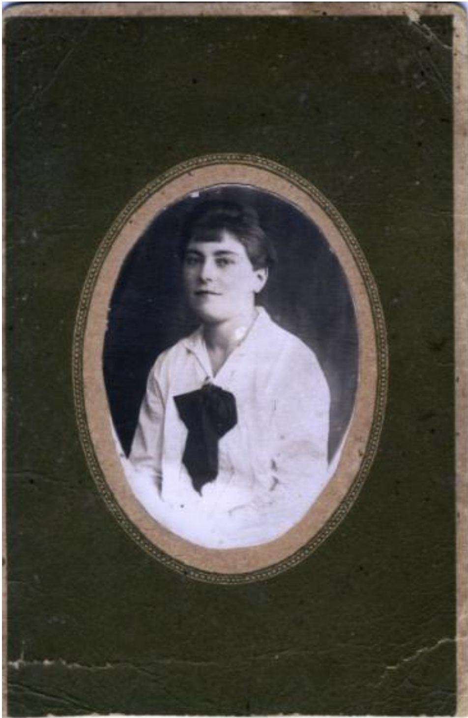
Первый год работы учителем. 1931 г.