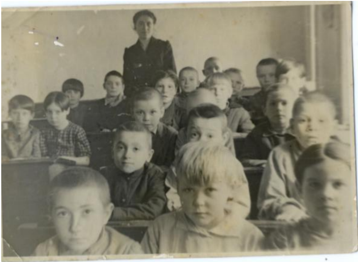
Урок во 2-ом классе 1946 год