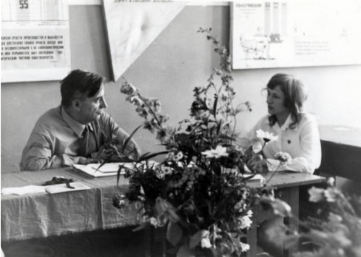
Белгородский индустриальный техникум

Затем переехал в Белгород, преподавал историю в индустриальном техникуме. Жизнь шла, как и у всех. Никаких поблажек никогда. Женился. Родились дети. В 1971 году получил, может быть, самую главную награду: стал заслуженным учителем школы РСФСР. Дождался внуков. Отпраздновал с супругой золотую свадьбу. Но бег времени неумолим, и его уже нет с нами».